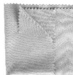
1x čistiaca handrička