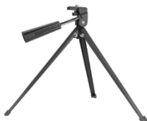
1x statív s vodiacou rukoväťou